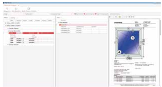
Einfach papierlos – übersichtlich.