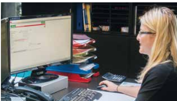
Digitale Fertigungsunterlagen am Monitor.

Die Dokumente werden, wie in MMC üblich, automatisiert und mittels modernster Barcode-Technologie über Barcodes eingelesen oder stehen bereits digital zur Verfügung. Den Mitarbeitern werden die Dokumente, welche sie schon in Papierform kennen, digital an einem Monitor angezeigt – sie sehen nur, was aktuell gebraucht wird.